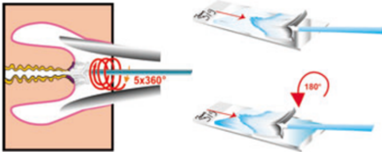
Рисунок 2. Правила забора материала для цитологического исследования цитощеткой и техника приготовления мазка.

8. Для взятия материала с эндоцервикса эндоцервикальной щеткой после введения её следует повернуть не менее трех раз против часовой стрелки (рис. 3b). Закономерно появление "кровоавой росы", что свидетельствует о получении информативного цервикального образца, где, кроме слизи, присутствуют клетки практически всех слоев эпителиального пласта.