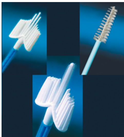
Рисунок 1. Вид рабочей части щеток для получения адекватного материала как с экто-, так и из эндоцервикса. Материал должен быть получен либо двумя щеткам (А, Б),